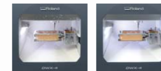
イオナイザーOFF イオナイザーON (イオナイザーは加工中、常に動作します)

集塵効果の高い機内構造とエアブローにより、加工中の機内を常にクリーンに保ちます。また、イオナイザーも装備し、PMMAの切削屑が静電気によって機内に付着するのを防ぎます。