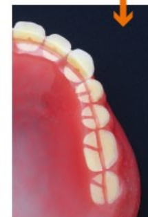
維持孔の形状設計図