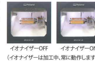
イオナイザーOFF イオナイザーON (イオナイザーは加工中、常に動作します)

集塵効果の高い機内構造とエアブローにより、加工中の機内を常にクリーンに保ちます。また、イオナイザーも装備し、PMMAの切削屑が静電気によって機内に付着するのを防ぎます。